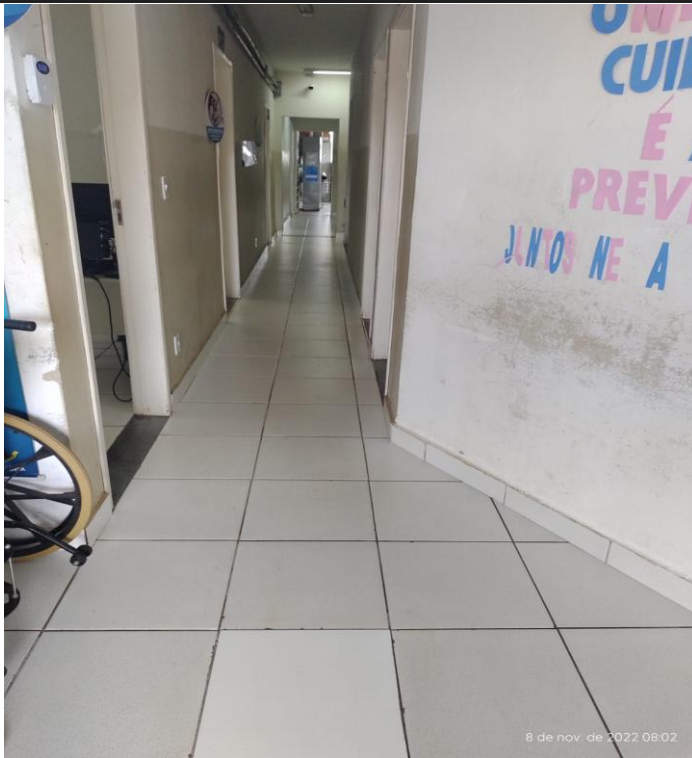
Figura 11 - Unidade de saúde Aeronautas.