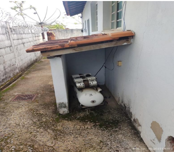
Figura 9 - Unidade de saúde Aeronautas.