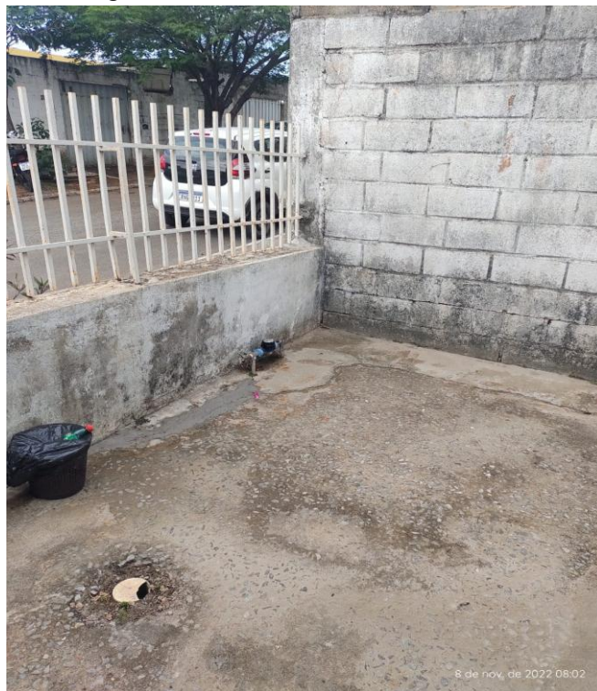
Figura 4 - Unidade de saúde Aeronautas.