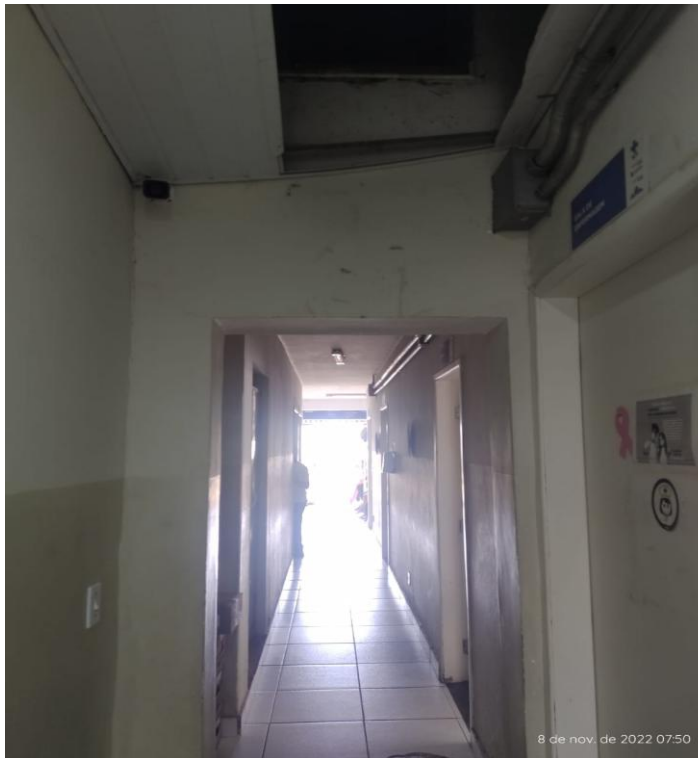
Figura 13 - Unidade de saúde Aeronautas.