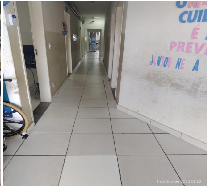
Figura 8 - Unidade de saúde Aeronautas.