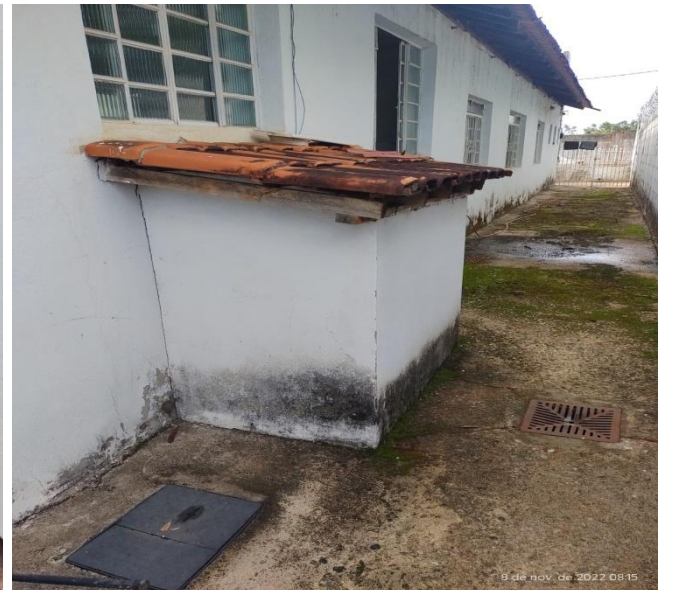
Figura 10 - Unidade de saúde Aeronautas.