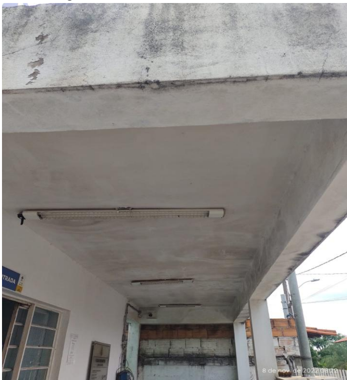
Figura 3 - Unidade de saúde Aeronautas.