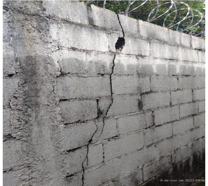
Figura 6 - Unidade de saúde Aeronautas.