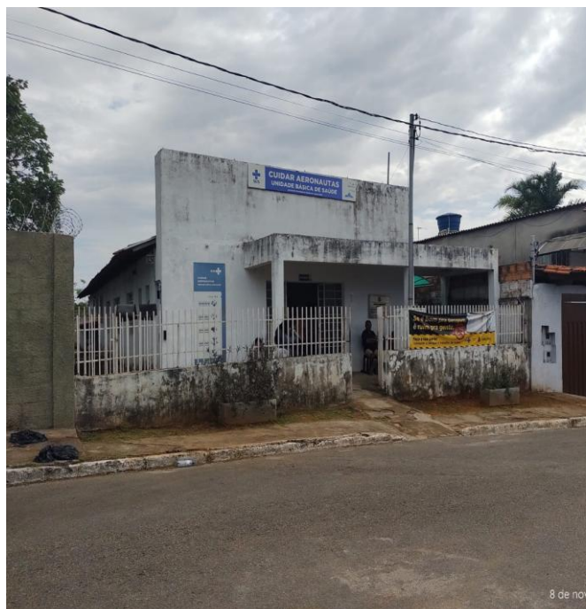
Figura 2 - Unidade de saúde Aeronautas.