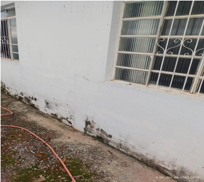
Figura 7 - Unidade de saúde Aeronautas.