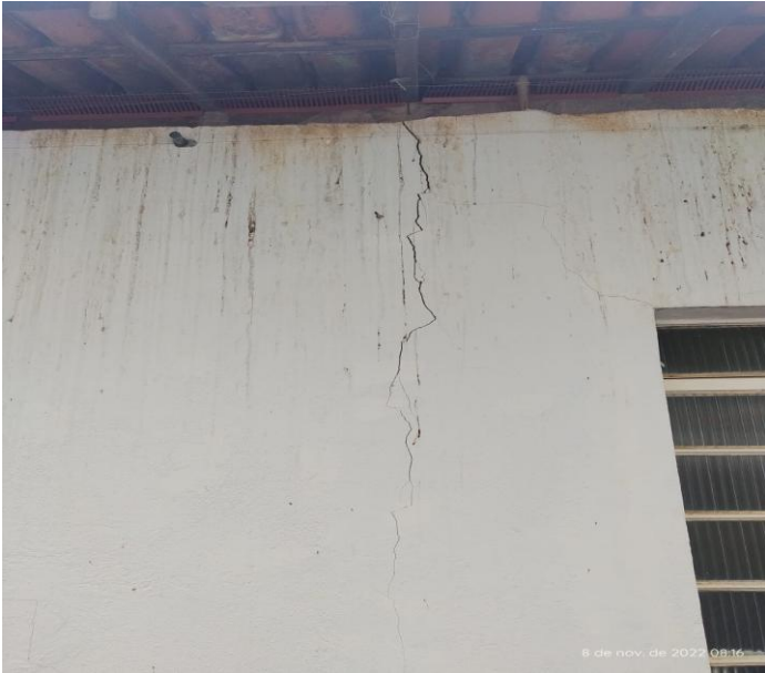
Figura 5 - Unidade de saúde Aeronautas.