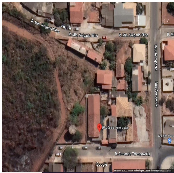
Figura 1 – Unidade de saúde Aeronautas.

OBJETO: CONTRATAÇÃO DE EMPRESA ESPECIALIZADA PARA A REALIZAÇÃO DA OBRA DE REFORMA DA UNIDADE BÁSICA DE SAÚDE AERONAUTAS.